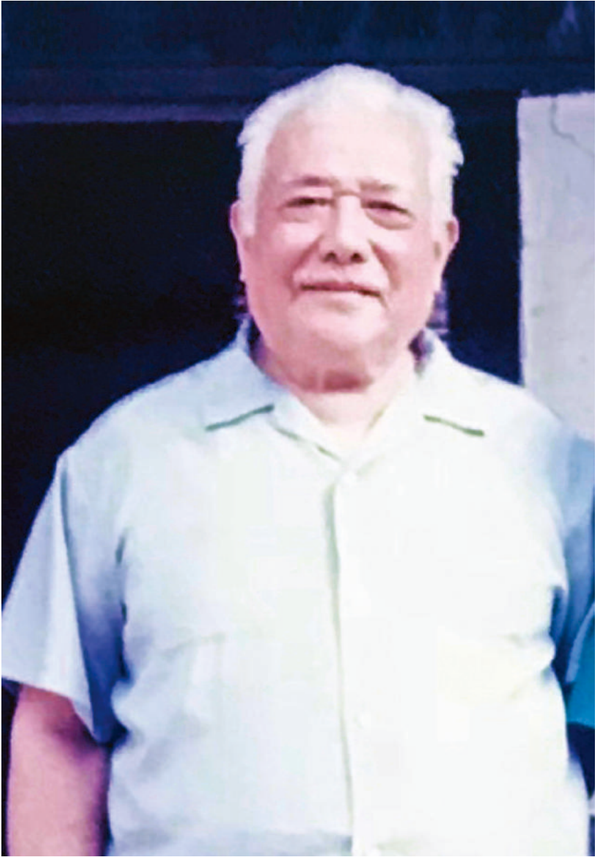
黃念祖老居士德相